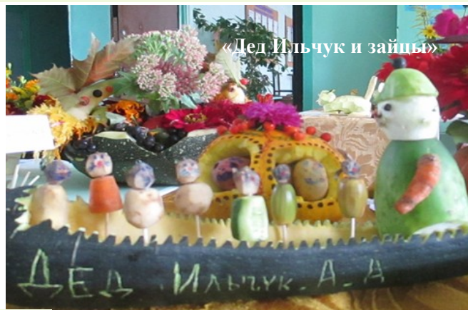
«Дед Ильчук и зайцы»

Сентябрьская осень – замечательное время года. Это пора яркого цветения георгинов, астр, хризантем, это богатый урожай плодов и овощей. А чего стоит золотой бал листопада! Вдохновленные таким осенним настроением студенты Нелидовского колледжа организовали выставку цветов и композиций «Удивительное рядом». Под руководством своих кураторов они превращали цветы, фрукты, овощи, природный материал в сказки, легенды, поэмы. Поражает, сколько выдумки, юмора вложили создатели в свои творения. Несколько дней зрители получали положительные эмоции от экспонатов выставки, удивлялись способностям и фантазии авторов.