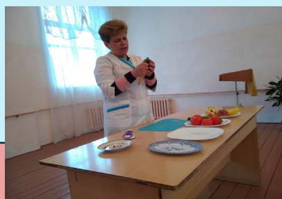
Мастер-класс на День повара