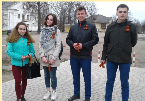
Волонтеры колледжа—участники акции «Георгиевская ленточка»