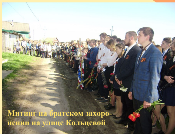
Митинг на братском захоронении на улице Кольцевой

Ты стала вновь могучей и свободной, Страна моя! Но живи навсегда В сокровищнице памяти народной Войной испепеленные года.