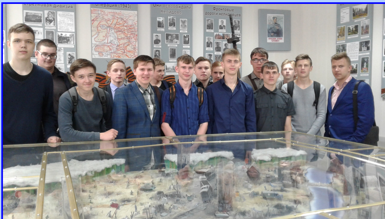
18 мая—День музеев. Группы № 8 и 7 посетили городской музей и познакомились с историей края. На фото –студенты в музее.