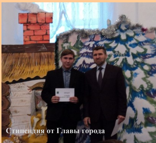
Стипендия от Главы города